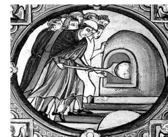
Paysans au four banal. Enluminure du XIIIe, Vienne.