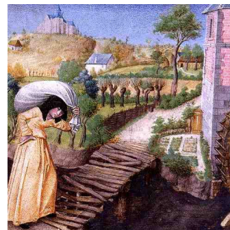
Une paysanne qui emmène son grain au moulin pour le moudre en farine.

Pour vivre dans la seigneurie, les paysans sont soumis au seigneur et lui versent des redevances (les banalités ) pour pouvoir utiliser les machines et instruments du domaine utiles à la production et la transformation des céréales sur lesquelles repose toute l'alimentation ( four, moulin, pressoir ...)